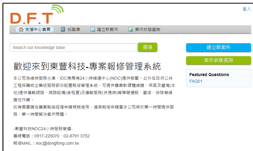
圖 專案報修管理系統